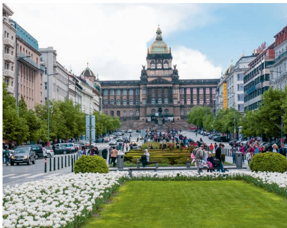
Weltbekanntes Wahrzeichen: der Wenzelsplatz