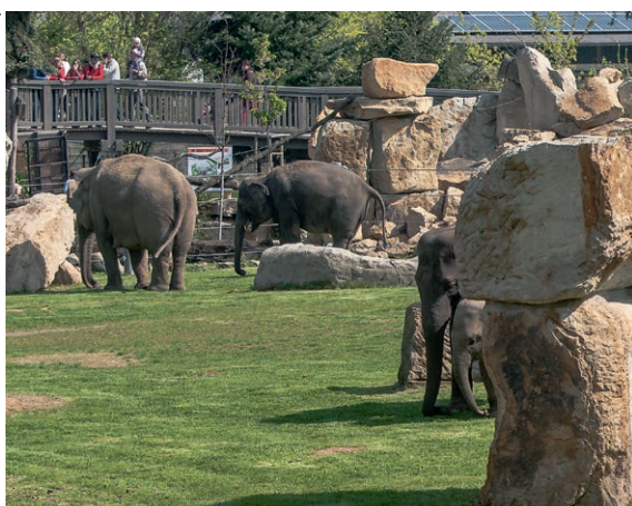
Eindruckliche Tierwelten im Prag Zoo