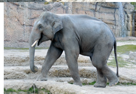
Ceyla-Himali beim gemütlichen Kauen (oben), Chandra, Druk, Omysha und Indi (v.l.n.r.) beim ersten Familienausflug (oben rechts) und Elefantbulle Thai auf Erkundungstour.