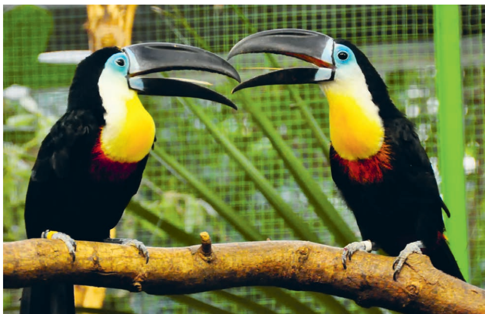
Grosse Klappe und farbenfroh gekleidet: die Dottertukane.