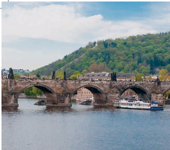
Malerisches Prag: Karlsbrücke